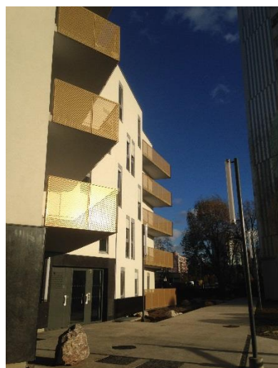
Photo du projet sur le boulevard Marcel Paul