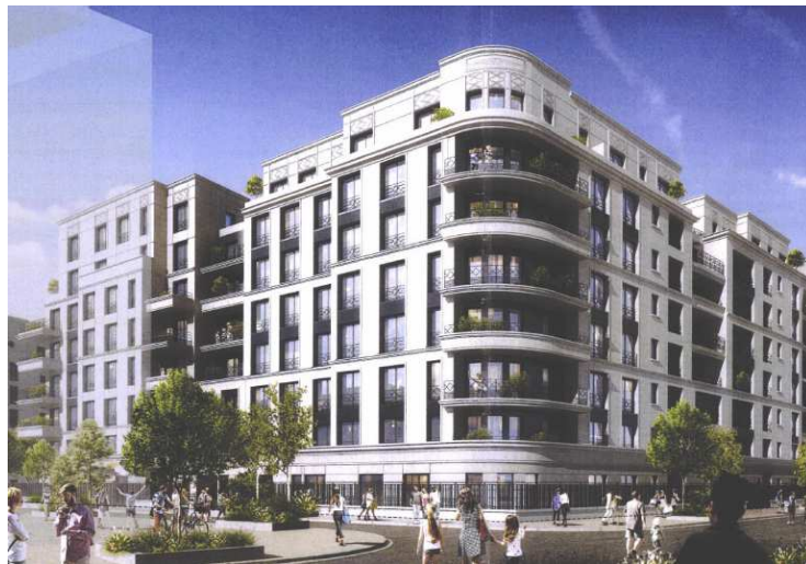
Perspective du projet – l'Îlot B2C