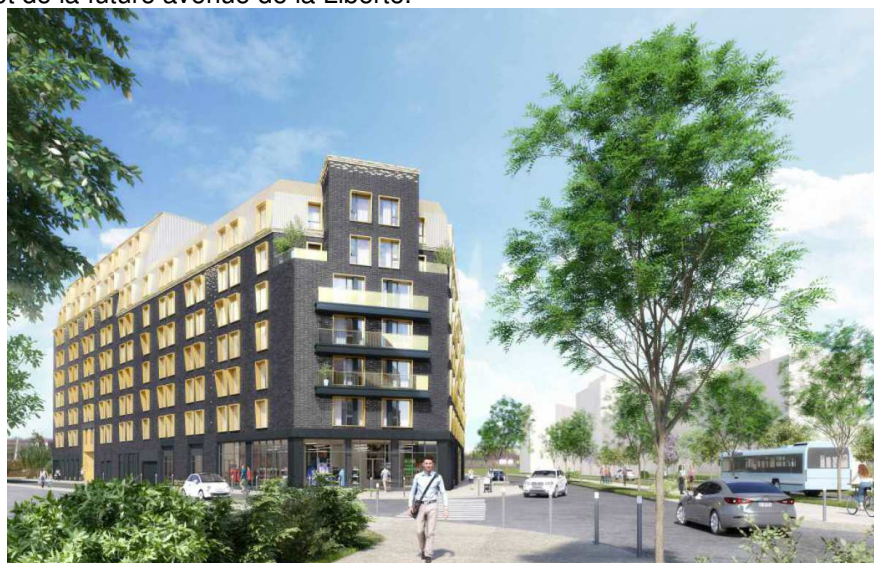
Perspective du projet

L'opération se situe sur l'îlot R8A de l'écoquartier des Docks de Saint-Ouen-sur-Seine au croisement de la rue de Clichy et de la future avenue de la Liberté.