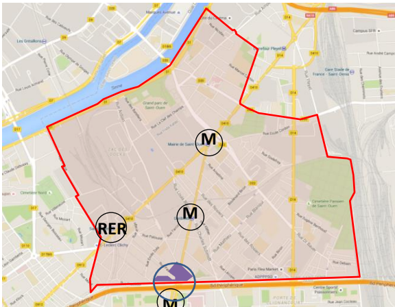
Localisation de l'opération