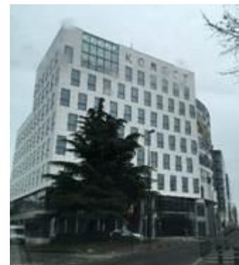
Livraison de bureaux neufs EIFFAGE IMMOBILIER – rue Lafontaine